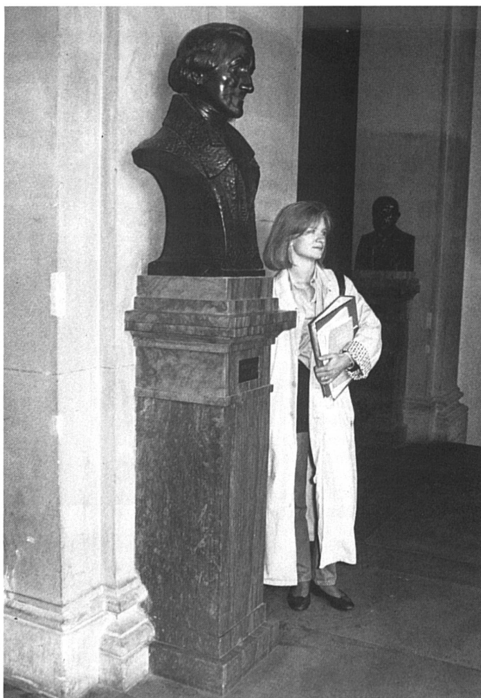
Le mariage aura-t-il finalement lieu entre la Suisse des «hommes en place» et celle des femmes en mouvement?