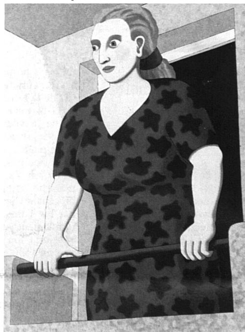
«Au Balcon», 1991.

L'art contemporain la laisse perplexe: «J'ai l'impression que les artistes d'aujourd'hui ne se définissent que par rapport aux autres, cherchant avant tout à être plus avant-gardistes que l'avant-garde. Beaucoup d'œuvres contemporaines sont