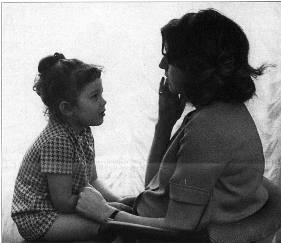
Sans pension alimentaire, la vie familiale sera bouleversée. Annoncer ces changements à l'enfant, c'est planifier l'avenir de la famille donc agir sur sa qualité.

Malgré la libération des mœurs, celle qui prétend à une pension alimentaire doit être, aujourd'hui encore, déclarée «innocente».