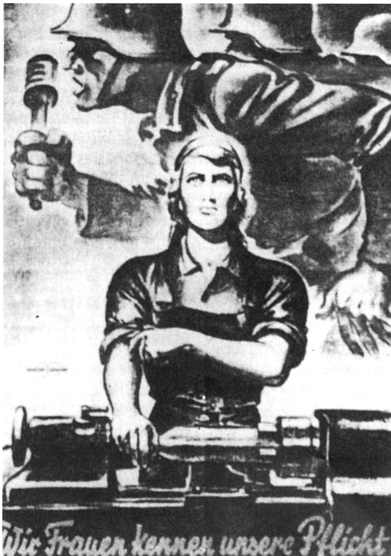
«Nous les femmes nous connaissons notre devoir.»