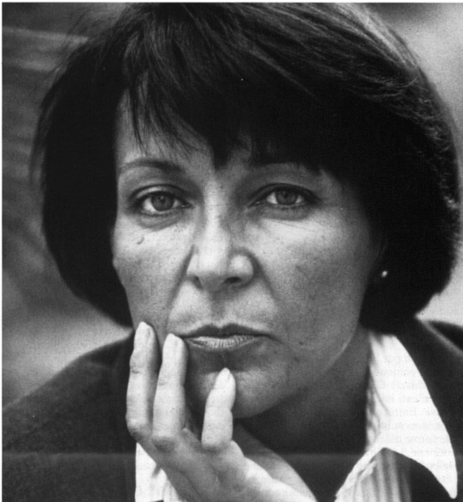
Yann Piat: elle était autrefois «la voix de son maître».