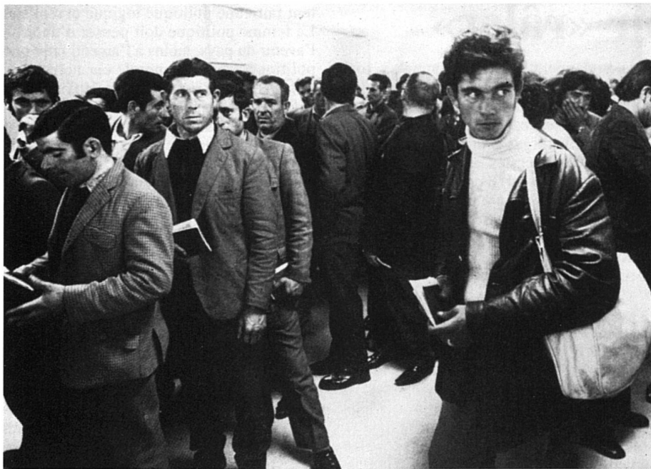
A nos frontières, ils attendent dans les centres d'accueil et d'hébergement, ignorants de la peur confuse qu'ils suscitent, sans armes devant la violence qu'ils engendrent.