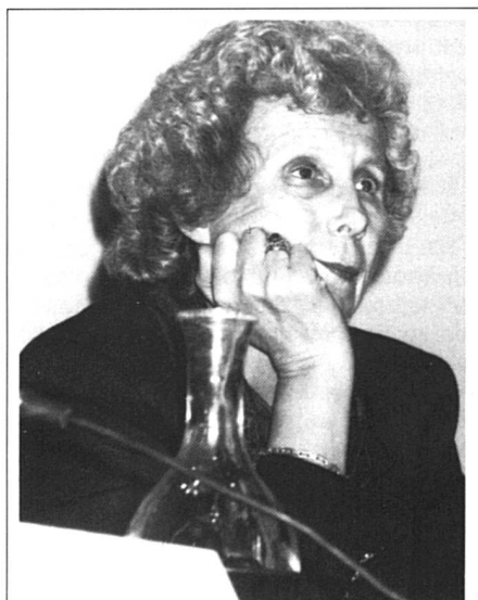
Elisabeth de Fontenay: «Nous avons invité celles et ceux qui croient encore aux droits de la personne humaine.»