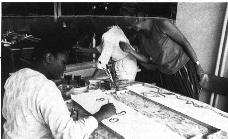
Des dessinatrices du Centre Camille-Martin.

Possibilité d'en commander une certaine quantité avec d'autres inscriptions ou sans ins-