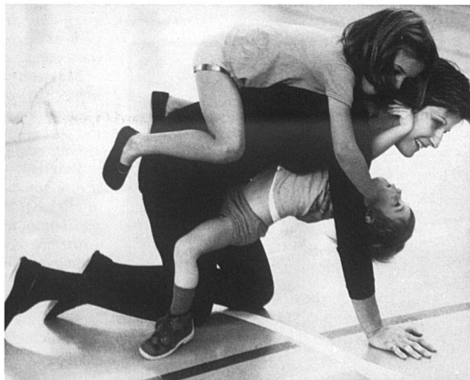
Se sentir responsable, figer le temps en une série de moments parfaits.

Vous allez me dire que je joue sur les mots, et que le souci existentiel dont parle Heidegger n'a qu'un lointain rapport avec le souci «que l'on se fait» pour soi-même ou pour celles et ceux que l'on aime. Je suis quant à moi convaincue qu'il s'agit