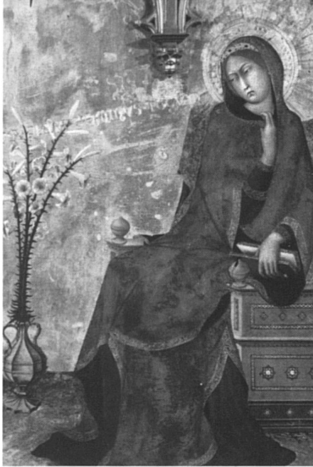
Marie, l'archétype de la mère, l'incontournable référence, avait-elle un désir d'enfant? (Simone Martini, Annonciation, détail, Florence, Musée des Offices)

«choix», et de «désir», tels qu'ils sont compris d'ordinaire. Nous avons pris le temps, chacune, d'interroger en nous ce désir, ce non-désir, ou cette ambivalence, passés ou présents, face à la maternité, en répondant à quelques questions à la fois banales et