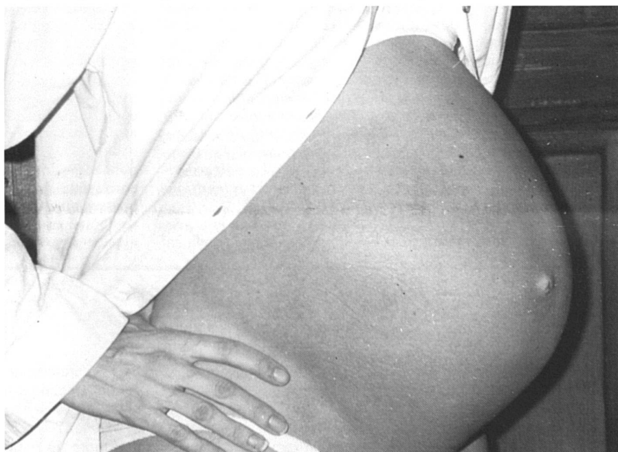
Le désir croît parfois en même temps que le ventre...

Obligée, donc, de penser à la maternité, comment ai-je analysé mon «refus»? Tout d'abord, il est difficile de s'avouer, tant cela est socialement réprimé, qu'on n'a jamais vraiment voulu un enfant. Bien sûr, parfois, l'envie me prenait, mais toujours en fonction d'une passion pour un homme. La phrase «fais-moi un enfant» a quelque chose de magique, mais à bien y réfléchir, seul le pouvoir érotique des mots m'intéressait, je ne donnais à ce genre d'énoncé aucune valeur performative! D'autres désirs fugaces me saisirent encore, mais toujours avec un antidote prêt à servir. A la vue d'un enfant particulièrement attendrissant, «c'est un cas spécial, un moment de grâce.» Une mère heureuse avec sa fillet-