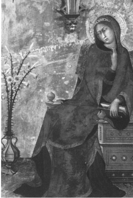
Marie, l'archétype de la mère, l'incontournable référence, avait-elle un désir d'enfant?

«choix», et de «désir», tels qu'ils sont compris d'ordinaire. Nous avons pris le temps, chacune, d'interroger en nous ce désir, ce non-désir, ou cette ambivalence, passés ou présents, face à la maternité, en répondant à quelques questions à la fois banales et