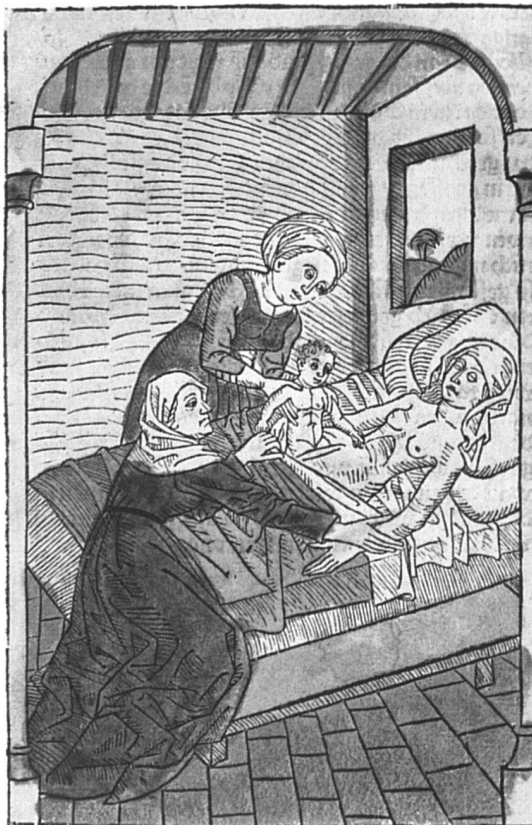
Les lois de la biologie vont-elles de pair avec le désir d'enfant? (Gravure sur bois, Allemagne, XV e siècle).

Sans enfants, j'aurais peut-être connu plus de succès professionnels, de pays, de cultures, de liberté, mais j'aurais moins... existé.»