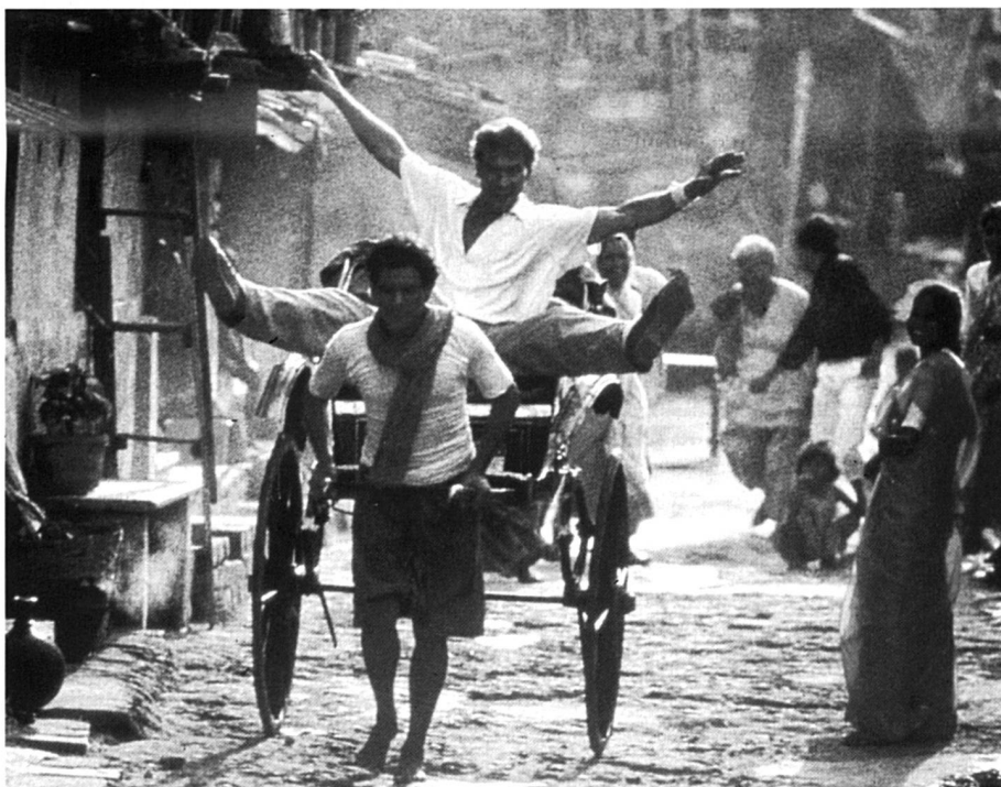
La Cité de la Joie: «A mesure que l'un perdra la foi, l'autre lui communiquera son dynamisme.»

Apparemment touffue et foisonnante de thèmes, cette première réalisation de Jon