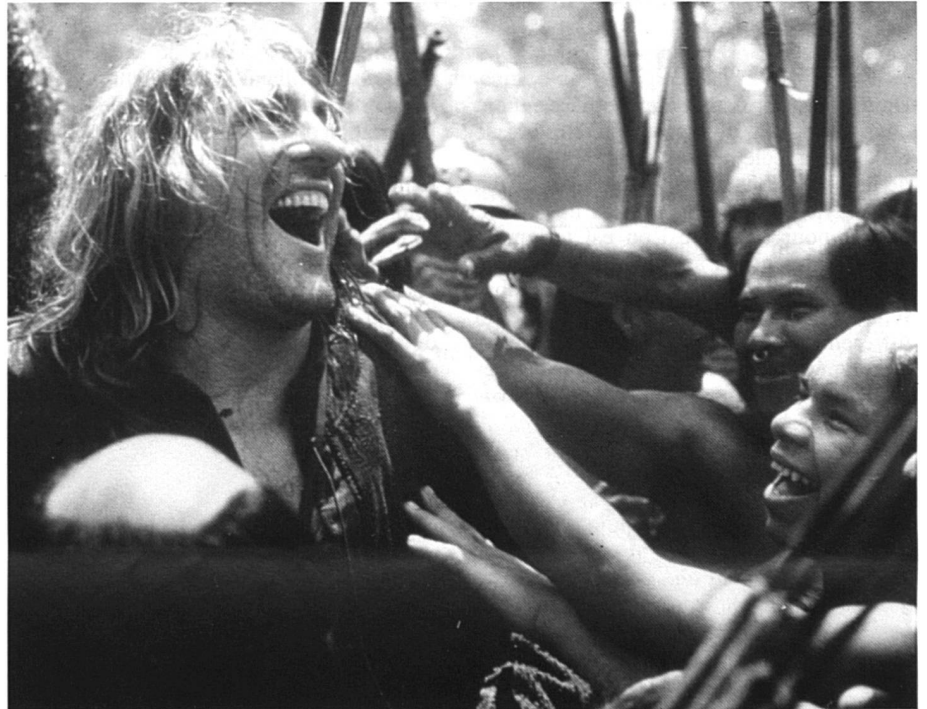
Un aventurier comme ceux que la jeunesse aime...

La musique, appuyée, grandiloquente, mielleuse, en est à mon avis grandement responsable. Cela commence par des gros plans de langues de pendus, du bruit, des flammes (Inquisition) qui n'arrêtent pas de