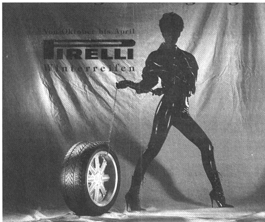
Un plaisir racé?!