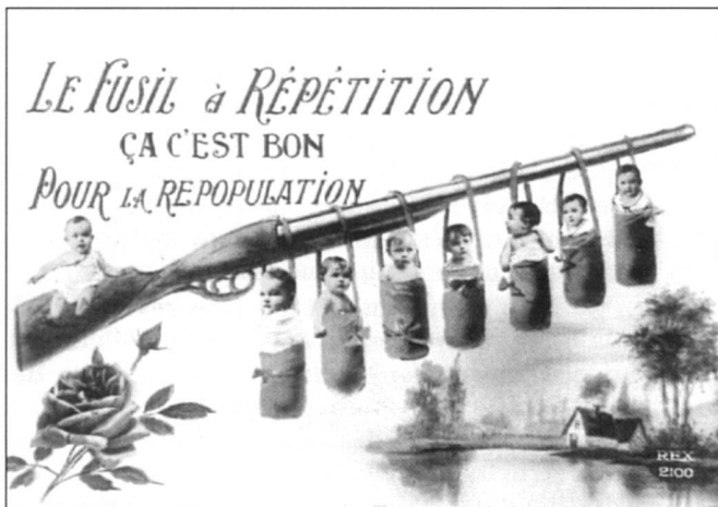
Carte postale vendue en France après la guerre de 1914-1918 dans le cadre d'une campagne de repopulation. D'autres cartes de la même série ont des titres moins «imagés», par exemple «Sans enfants aujourd'hui, plus de France demain».