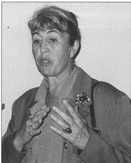
Inger Lise Gjør, présidente du Parlement norvégien: «Les hommes adorent représenter les femmes.»

Aujourd'hui, la coopération entre le Nord et le Sud est urgente et inévitable, sinon le Nord, dans son opulence, devra faire face à la recrudescence de la pauvreté dans le Sud, aux problèmes d'immigration qu'elle provoque, au racisme et à la violence qu'elle engendre. Des contrats de solidarité doivent s'établir entre le Nord et le Sud