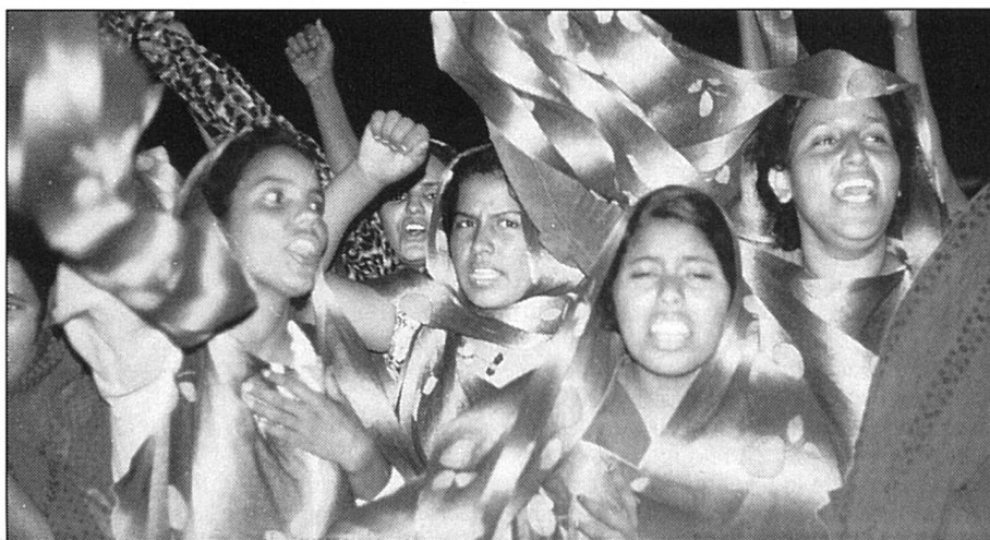
Elles ont une voix à faire entendre.

Loin de nous l'idée de repousser le problème de l'islamisme et du renouveau intégriste (FS y a consacré un dossier en février 1990). Ce que nous voulons montrer, c'est que les femmes de là-bas, d'est en ouest, entre Méditerranée et Sahara, océan Atlantique et désert de Lybie, ont une voix qu'elles savent faire entendre. Même si la tradition musulmane a cherché durant longtemps, et encore aujourd'hui, à les bâillonner et à les museler. «Ce n'est pas l'islam, qui est l'une des religions les plus tolérantes et respectueuses de l'individu, mais l'interprétation patriarcale du Coran et des