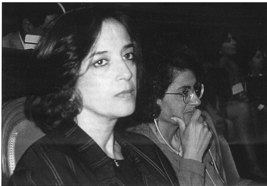
Pour les femmes algériennes, un avenir incertain.

Les sources historiques ont été tirées essentiellement de l'Agenda des femmes arabes, 1993, de Sakina Ballouz-Cherrad.