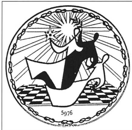
Emblème de la Grande Loge Féminine de Suisse.