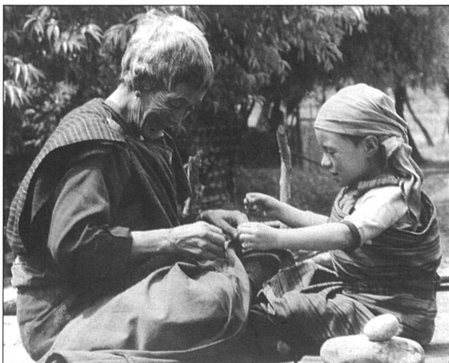
Grand-mère et petite-fille, la transmission d'un savoir culturel.

Le calendrier Helvetas ainsi que quantité d'autres articles - le catalogue général peut être obtenu gratuitement - sont à commander au (021) 323 33 73. Vente directe: av. de la Gare 38, 1001 Lausanne.