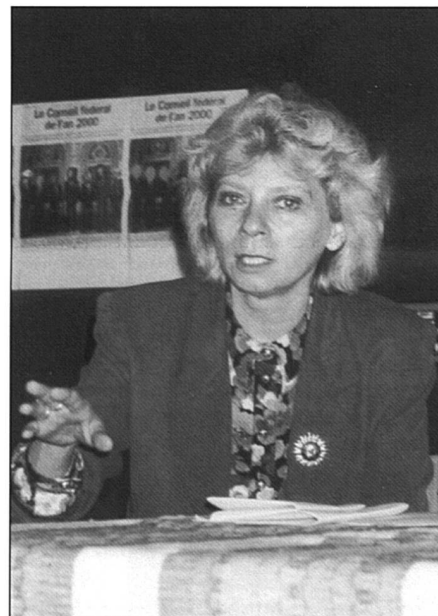
Christiane Brunner: la rente unique est une pure manœuvre dilatoire.

Dès qu'on entre dans les détails, il n'y a pas de réponse aux questions que nous posons. Qu'en serait-il par exemple des femmes mariées qui n'ont pas cotisé? Le système de la rente unique n'est simple qu'en apparence, il correspond plus à une philosophie d'assistance (pas de relation entre le montant de la cotisation et le montant de la rente) qu'à une vraie philosophie de l'assurance sociale.