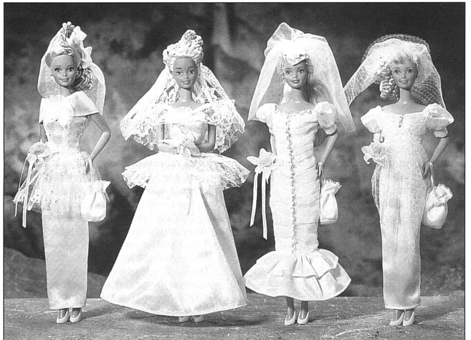
La poupée Barbie, plus mince que la plus mince des mannequins – modèle mythique des ados. (Illustration tirée du film La Sposa contenta d'Elda Guidinetti)

peur de l'exclusion dont elles pourraient être victimes en devenant femmes: «(...) En se projetant dans le futur, elles constatent que (...) les hommes sont récompensés par le biais de leurs activités sociales, alors que les femmes sont soit exclues de la vie