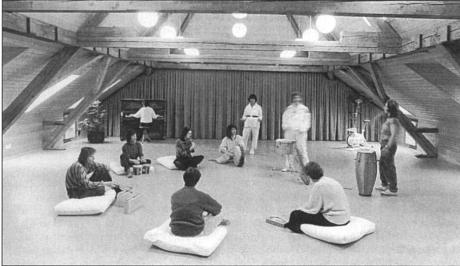
Produire des sons et s'imprégner de musique fait partie d'une prise de conscience de soi-même.