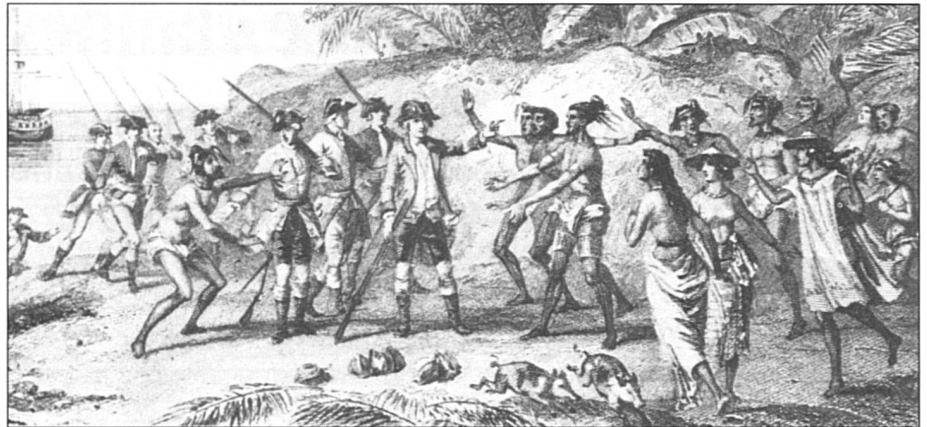
L'arrivée à Tahiti.

En mai 1768, le jeune Barret est démasqué. Bougainville le fait comparaître. L'infortuné avoue qu'il est fille. «Ni laide ni jolie» dira Bougainville, et il consigne simplement dans son journal de bord que Jeanne Barret est la première femme à faire le tour du monde. Un record aujourd'hui oublié des dictionnaires. Arrivés à l'Isle-de-France, Philibert Commerson et Jeanne Barret quittent l' Etoile car on a besoin de leurs talents pour l'étude de la