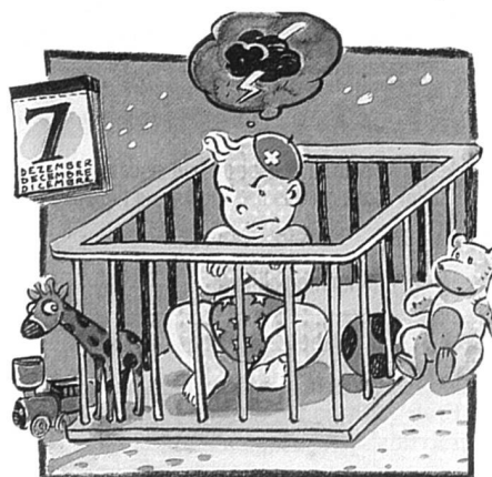
Comité Né le 7 décembre.