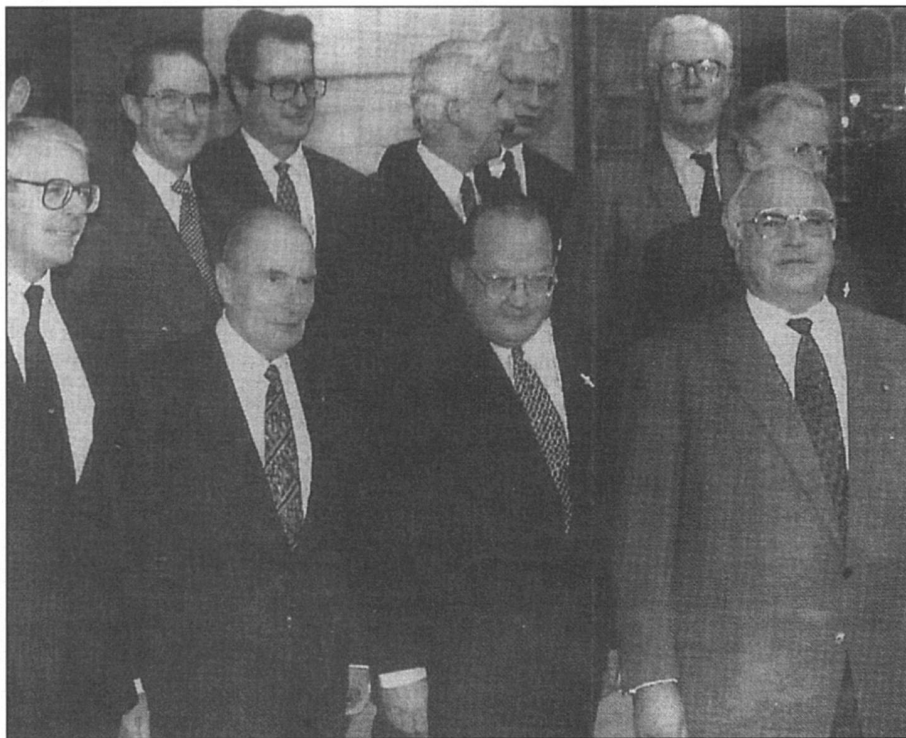
La première photo de la «famille européenne». Vendredi à Bruxelles.