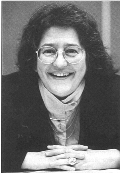
Gret Haller.

La première période bernoise est marquée par son installation à Berne en 1975, l'ouverture d'une étude d'avocat, l'entrée au Parti socialiste, suivie d'une élection au Législatif de la ville de Berne, et par l'affirmation de son engagement féministe. Point fort de cette période, son élection à la Municipalité de Berne en 1984, où on lui confie la direction des écoles. Gret Haller est à l'écoute de ces jeunes qui cherchent leur place dans la ville. Elle s'oppose durement à son collègue qui dirige la police, lorsque celui-ci ordonne l'évacuation par la force du «village autonome des