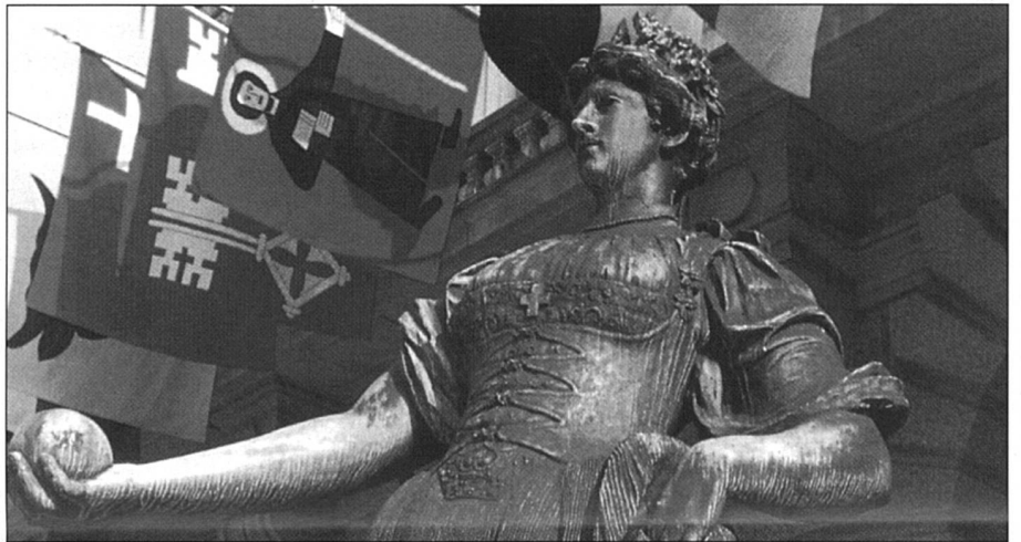
Sur la quinzaine d'actions en justice, la majorité concernent des fonctionnaires d'administrations cantonales.

La plupart des femmes qui se sont adressées aux juges avaient changé de place ou avaient été licenciées. Sur la quinzaine d'actions en justice intentées depuis 1981, la majorité concernent des fonctionnaires d'administrations cantonales. Dans une bonne partie des cas, le procès a porté sur une activité professionnelle exercée en grande majorité par des femmes, ce qui a imposé par conséquent une comparaison entre travaux de nature différente. Les professions d'infirmière, de maîtresse de travaux manuels, de maîtresse d'école ménagère, de secrétaire et de jardinière d'enfants ont dû faire l'objet d'une évaluation, qui a montré combien il est difficile de prouver l'équivalence du travail fourni. D'où de longs procès, souvent onéreux, donnant lieu à des expertises coûteuses et conduisant parfois jusqu'à l'épuisement des voies de recours. Plusieurs cas sont montés au Tribunal fédéral, lequel a constaté que les instances juridictionnelles inférieures avaient négligé d'éclaircir suffisamment les faits. A l'exemple des jardinières d'enfants de Bâle-Ville, où l'administration cantonale s'expose à une pluie de recours qui risquent de lui coûter cher. C'est ce qui explique aussi la démarche du gouvernement saint-gallois qui conteste les conclusions de