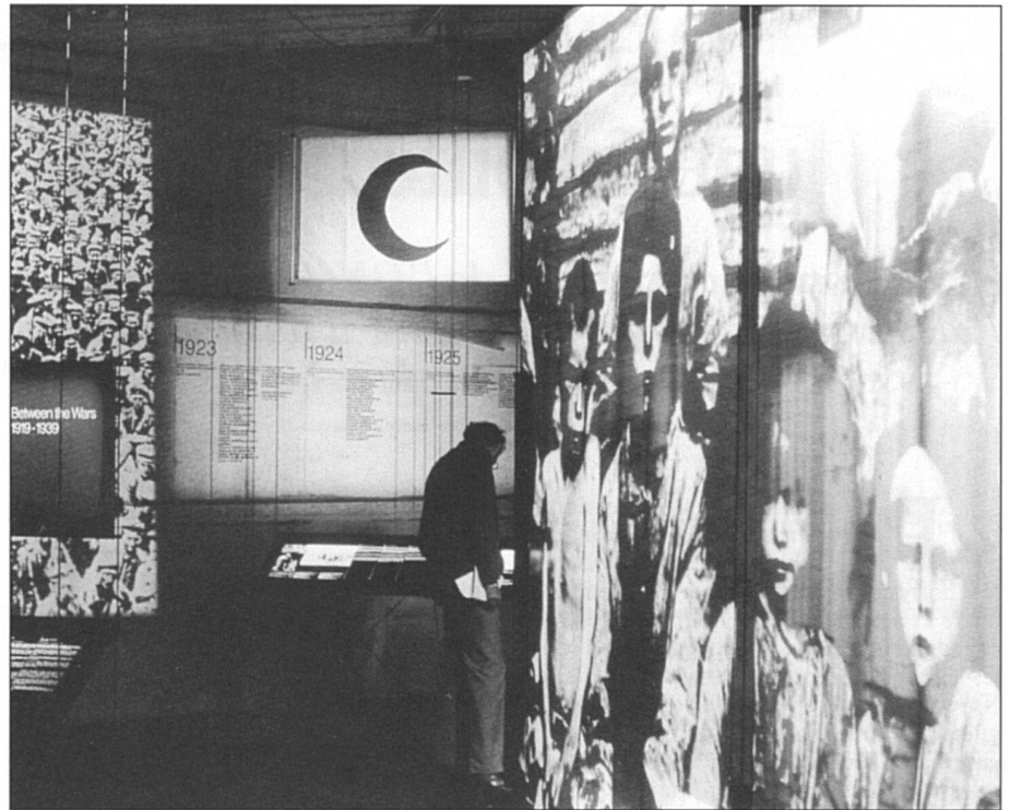
Les musées: lieu privilégié pour conserver la mémoire vivante.

Les victimes et les défenseurs des droits de la personne suspectent en effet les Grandes Puissances de se contenter de ne vouloir juger que «des petits poissons», au détriment des véritables mandataires des pillages, viols systématiques, destructions massives, tortures, assassinats, internements arbitraires, expulsions et autres actes de terreur, commis principalement par les