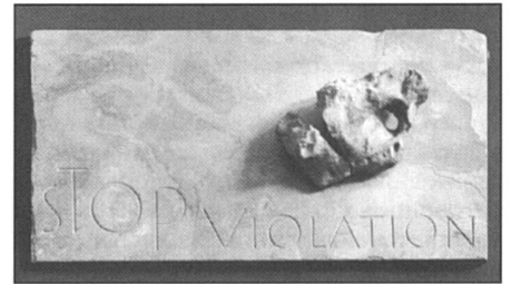
Le 8 mars 1993, des femmes s'unissaient pour réclamer un tribunal qui juge les viols comme crime de guerre.

dans les autres républiques issues de l'ex-Yougoslavie, mais également dans les pays où elles ont trouvé refuge.» Malheureusement, une telle protection n'existe pas aujourd'hui. Que ce soit pour celles qui iront témoigner à La Haye, ou pour celles qui ont trouvé une terre d'asile provisoire hors de leur pays. Récemment, certains colis piégés adressés à des victimes de crimes de guerre ont été trouvés en Autriche. Certaines personnes sont également menacées d'être réexpédiées en Bosnie-Herzégovine, où la guerre et la purification ethnique conti-