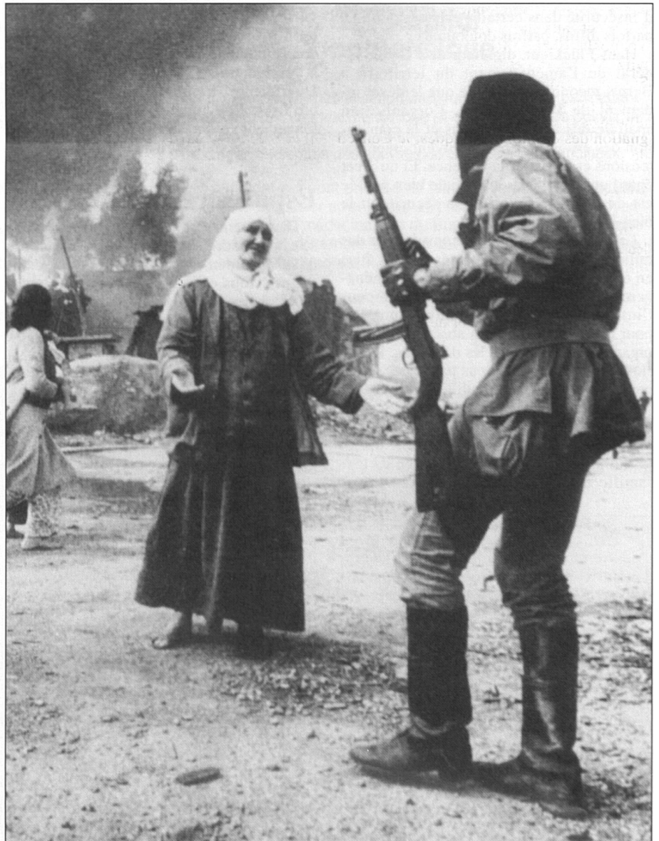
La victime et son bourreau. Un bourreau qui ne sera peut-être jamais puni.

Et puis ces tribunaux, avec toutes les failles de la justice humaine bien évidemment, permettent de conserver la mémoire des faits, des souffrances. Sans le jugement des crimes de guerre du Japon qui aurait su que des milliers de femmes avaient été violées à Nankin? Brigitte Mantilleri