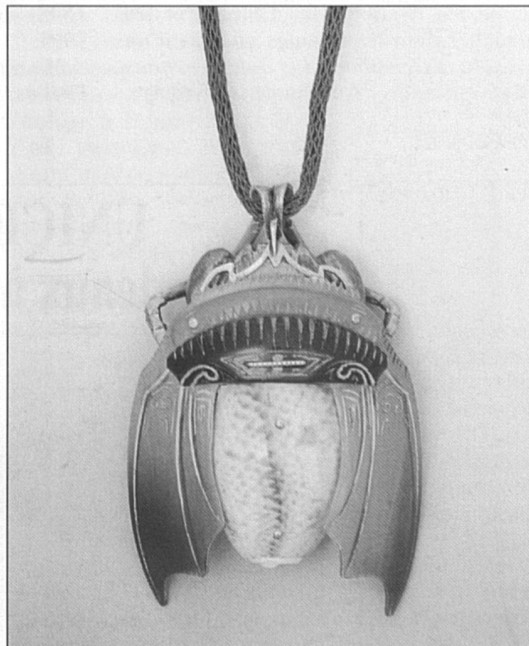
1924. Corne, écaille, coquillage.

Exposition ouverte du 29 novembre 1994 au 27 août 1995