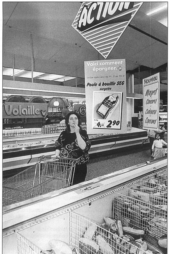
Flâner dans les magasins peut devenir instant de détente et loisirs.