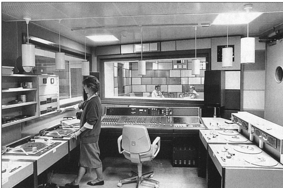
La RTSR n'est pas en reste.