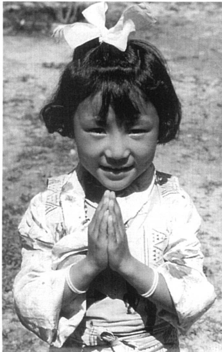
Les droits de cette petite Tibétaine seront-ils enfin un jour reconnus par la Chine?

Même si ce texte n'a aucune valeur contraignante pour les pays signataires, il