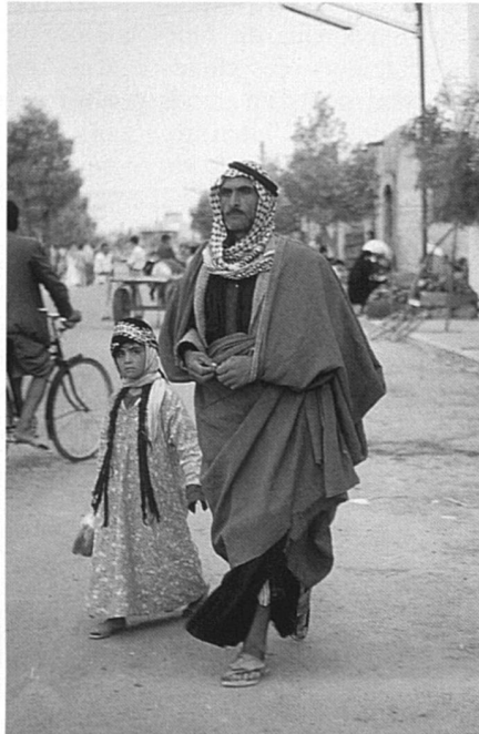
Syriens, Syriennes (1992-1994), Ed. Zoé.

«La Bible, ton paysage fout le camp! De quelque côté du front que l'on se place. Ce que la guerre n'aura pas détruit, l'homme s'en chargera. Oliviers poussiéreux, moutons qui moutonnent, villages mariés à la craie des collines, lenteur, harmonie, tout ça s'efface, s'effacera, disparaîtra... Singapour-en-Palestine, Coca-Cola-sur-Jourdain, Miami-sur-Mer Rouge, nous promettent les promoteurs complices, tant Israéliens qu'Arabes. La paix est dans l'air et leurs plans dans leurs tiroirs. De la laideur clé en main» (page 21)