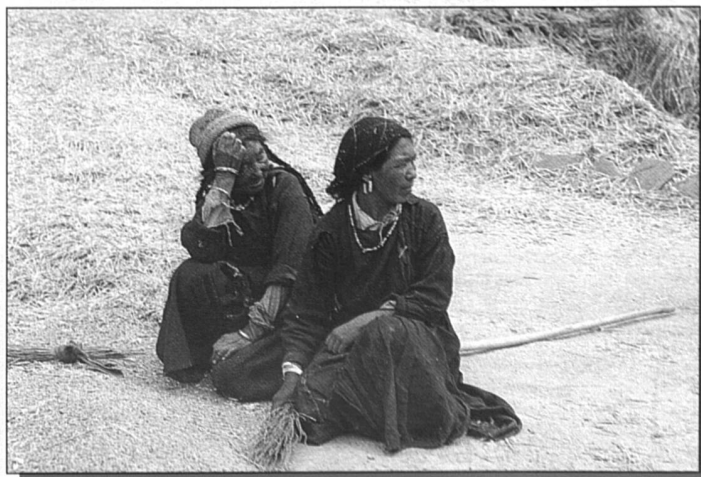
Instant de repos sur l'aire de battage de l'orge, culture principale de cette contrée. Cette unique récolte, fauchée à plus de 3500 mètres d'altitude, devra nourrir les familles durant un hiver long et rigoureux. A cela vient s'ajouter un maigre produit d'élevage, les pâtures se résument à quelques pousses d'herbe disséminées dans les pierriers.