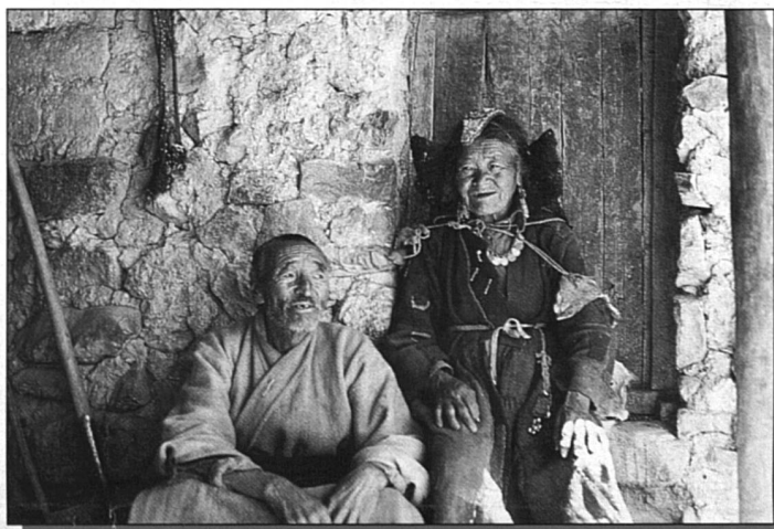
Hors du temps et de la civilisation moderne, un couple heureux.