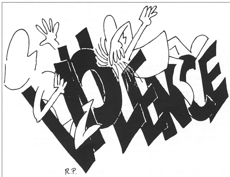
Illustration parue sur la couverture de la revue Expression éditée par l'Hospice général de Genève, lors d'un récent numéro consacré à la violence.

Autre traduction du peu de cas fait à la violence conjugale: la relative indifférence entourant les maisons pour femmes maltraitées. Elles sont au nombre de treize en Suisse. La première a ouvert ses portes à Genève en 1977. En 1992, ces centres d'accueil ont reçu environ 630 femmes et autant d'enfants, ce qui représente 42 000 nuitées. Cependant, ils ont dû refuser 750 femmes, faute de place. Les maisons sont souvent mal protégées et menacées par les maris ou les amants. Tout le monde a encore en mémoire le drame survenu à la Frauenhaus de Lucerne. Un Tessinois avait abattu sa femme lors d'une fête. La maison avait dû engager des Securitas pour assurer la surveillance des alentours. L'événement a