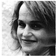
4 Gardi HUTTER Clown