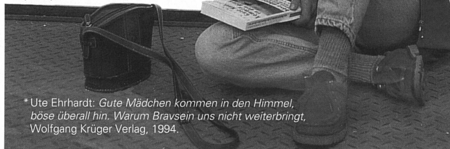
* Ute Ehrhardt: Gute Mädchen kommen in den Himmel, böse überall hin. Warum Bravsein uns nicht weiterbringt , Wolfgang Krüger Verlag, 1994.

Oui, sûrement. Mais je dois dire qu'après un certain temps, j'ai arrêté de collaborer au journal. Il y avait plusieurs raisons à cette décision. C'était devenu difficile à assumer. Je souffrais des débats que je provoquais. Remettre sans cesse en question les relations hommes-femmes touche finalement à la sphère personnelle. Avec le féminisme revenait aussi à la surface la séparation de mes parents. Le féminisme de ma mère en était peut-être une des causes. C'est du moins ce que prétendait mon frère. Féminisme rimait de plus en plus avec rupture et sépa-