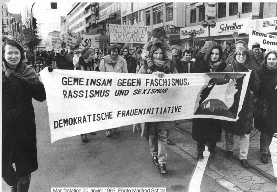
Manifestation 30 janvier 1993.