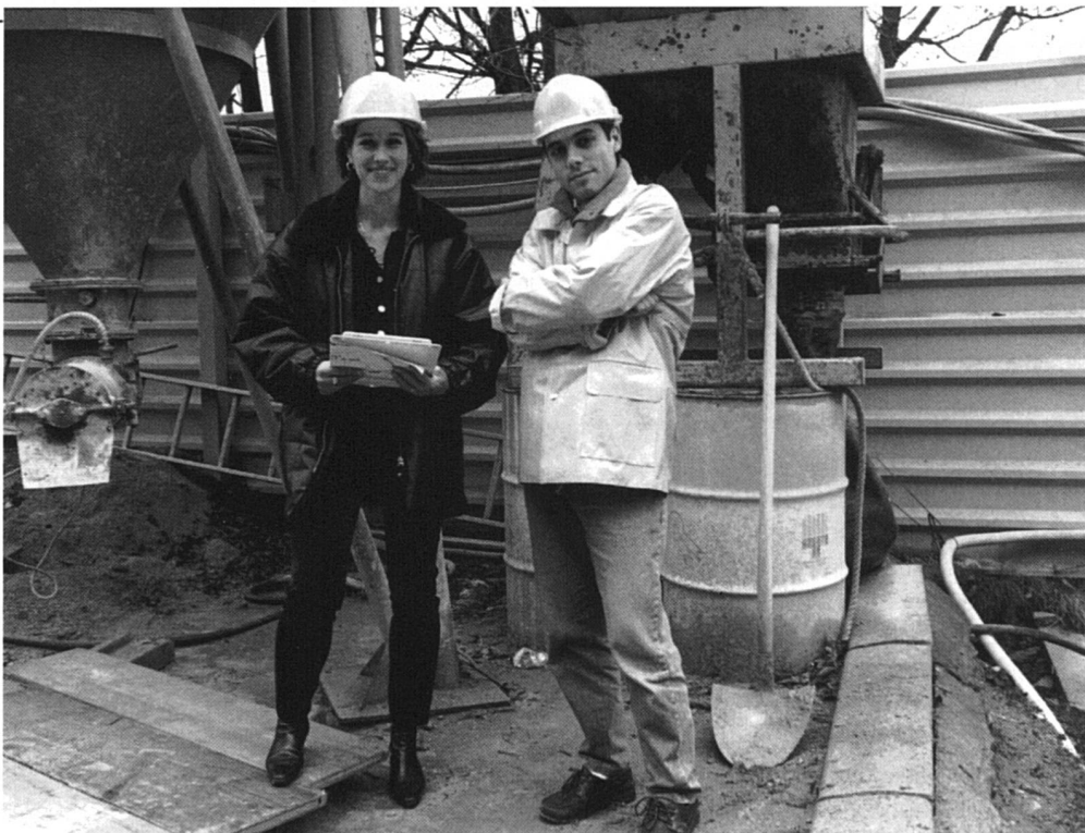
«Ingénieurs, ingénieures»

Au fil des années, l'expérience confirme que c'est bien à travers nos outils habituels de psychologue (notamment la capacité de reconnaissance de l'autre dans ses envies, ses rêves, ses peurs, ses doutes... «rôle de contenant», ainsi que la capacité à reformuler un vécu... «effet miroir») que nous pouvons le mieux répondre aux demandes. Celles-ci, au-delà des conseils et informations pratiques, se situent, aussi bien chez les jeunes que