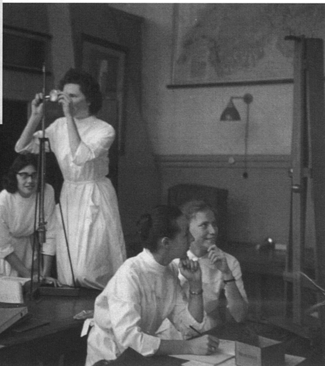
Labo de Physique, mai 1958

La situation des femmes s'est légèrement améliorée en Suisse au cours des dernières années, sur le plan de la formation ou de la politique. Mais les femmes gagnent encore en moyenne 24% de moins que les hommes. Et elles consacrent 23 heures par semaine aux tâches domestiques contre une moyenne de 10 heures pour les hommes. Ou bien: Des chercheurs de l'Office de recherche pédagogique du canton de Berne ont conclu, dans le cadre du Programme de recherche «Efficacité de nos systèmes de formation» PNR 33, qu'en Suisse les filles ont moins confiance en elles en mathématiques et en sciences naturelles , ce qui explique qu'elles sont en moyenne moins bonnes que les garçons dans ces branches. Les enseignants ont tendance à considérer que les maths sont une affaire d'hommes. Et encore: Les Écoles polytechniques de Zurich et de Lausanne vont pour