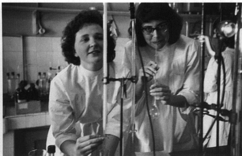
Labo de Chimie, dosage des chlorures, mai 1958

les filières scientifiques, pourquoi elles rechignent à passer des doctorats, pourquoi elles sont aux abonnées presque absentes des postes importants, pourquoi on veut donner l'impression que les femmes découvrent le monde du travail, alors qu'une bonne partie d'entre elles a toujours été sur le marché de l'emploi – mal rétribué, pourquoi les journaux relatent de manière absolument récurrente les mêmes préoccupations, dont voici quelques exemples: