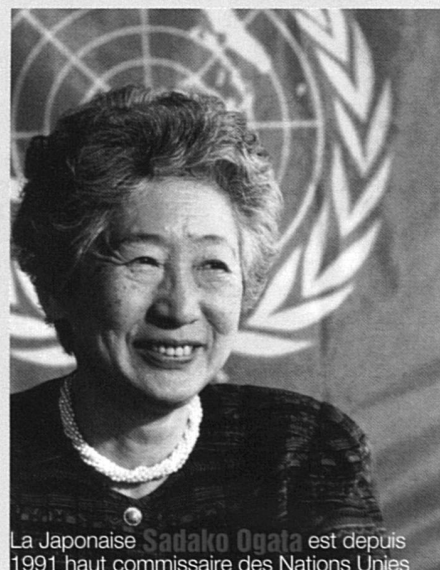
Sadako Ogata.

«Je serai implacable. Je veux briser le cercle de l'impunité. Je n'hésiterai pas à dénoncer les violations des droits de l'homme quand cela sera nécessaire». Parole de Mary Robinson! Le nouveau haut commissaire des Nations Unies aux droits de l'homme (à quand la réforme non seulement de l'ONU, mais aussi de son langage?), a annoncé la couleur dès son entrée en fonction, le mois dernier à Genève. Loin de se contenter de jouer les diplomates en coulisses comme son prédécesseur, l'ex-présidente irlandaise entend donner à son nouveau mandat humanitaire une place politique de premier ordre sur la scène politique internationale.