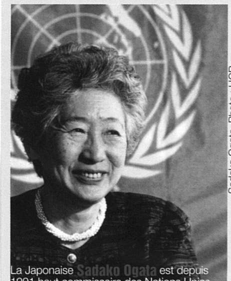
Sadako Ogata.

La mission de Mary Robinson semble presque impossible, puisqu'elle est censée se préoccuper du sort des plus faibles sans offusquer les plus forts. Avec son prestige d'ex-présidente d'un petit pays réputé de «fortes têtes», Mary Robinson démontre qu'elle a le sens de la diplomatie et de la suite dans les idées: «Je souhaite construire des ponts dans le cadre d'une approche plus élargie des droits de la personne. Afin de rapprocher les perceptions différentes qu'en ont le Nord et le Sud. Des terrains d'entente seront ainsi plus faciles à trouver, ce qui permettra aussi d'être plus crédible et mieux écoutée.» Pour ce faire, elle se rendra «sur le terrain» aussi souvent que les situations d'urgence l'exigeront. Sans oublier de renforcer l'espace politique qu'elle s'est ouvert à New York, siège du Conseil de sécurité et «antre de décisions» par excellence. Mary Robinson n'a d'ailleurs pas manqué de s'y rendre dès son entrée en fonctions, s'entretenant même avec une trentaine de chefs d'Etat, de gouvernement et autres ministres des affaires étrangères. Faisant d'une pierre deux coups, elle a rappelé que la réforme des Nations Unies passait également par une plus grande efficacité de l'office qu'elle dirige désormais, appel du pied voilé aux donateurs. Et d'ajouter, à l'adresse de ceux qui la voient déjà concurrencer leur sphère d'influence: «En tant qu'Irlandaise, je n'ai pas l'intention de construire un empire!»