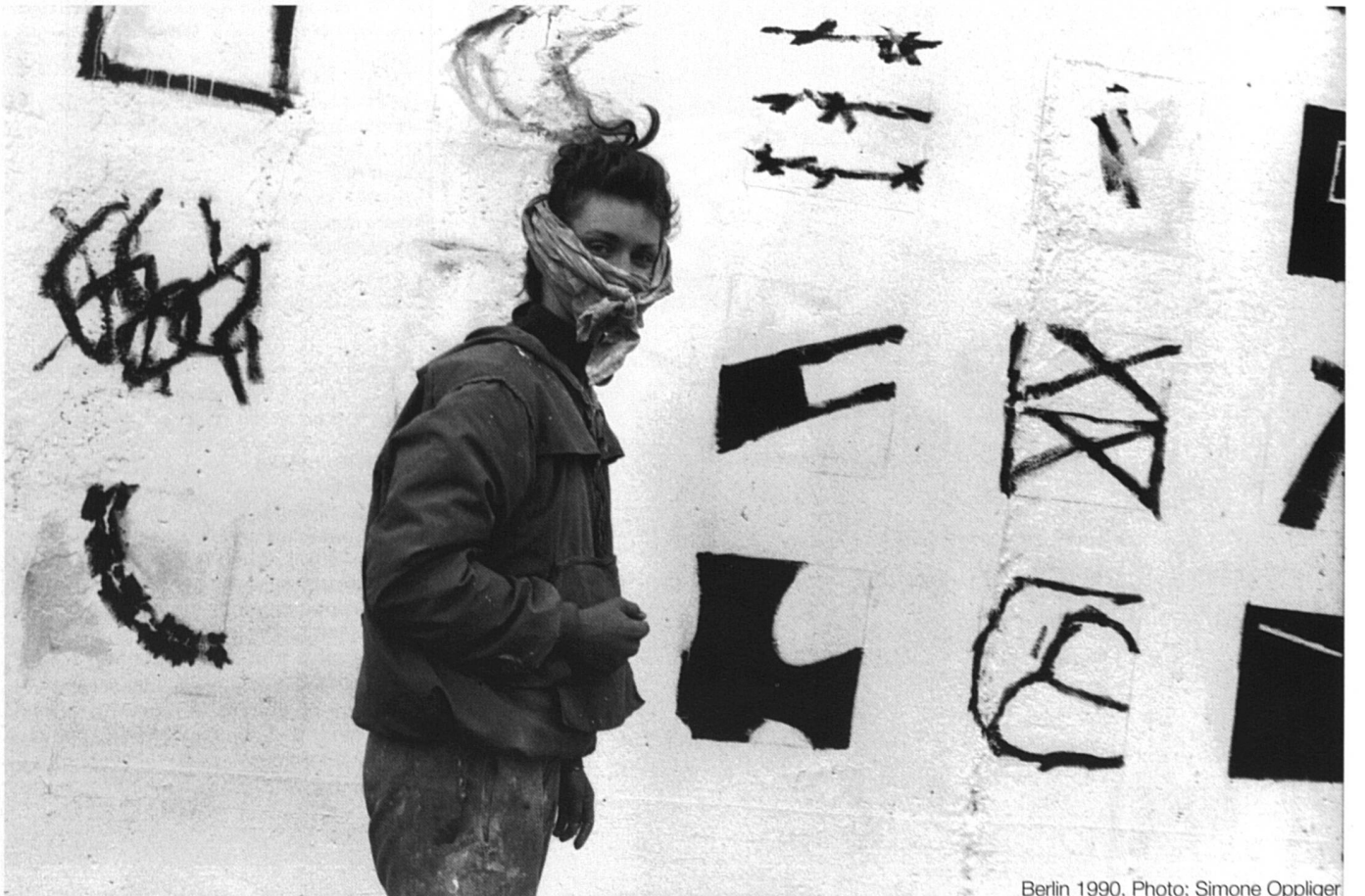
Berlin 1990.

«C'est à Berlin, quelques semaines après la chute du Mur. Une jeune femme peint. (Elle porte un bandeau à cause de la peinture). Une femme créatrice, c'est forcément une féministe. Créer, c'est avoir son point de vue sur les choses, c'est s'affirmer. Créer, c'est la plus belle façon d'être féministe.»