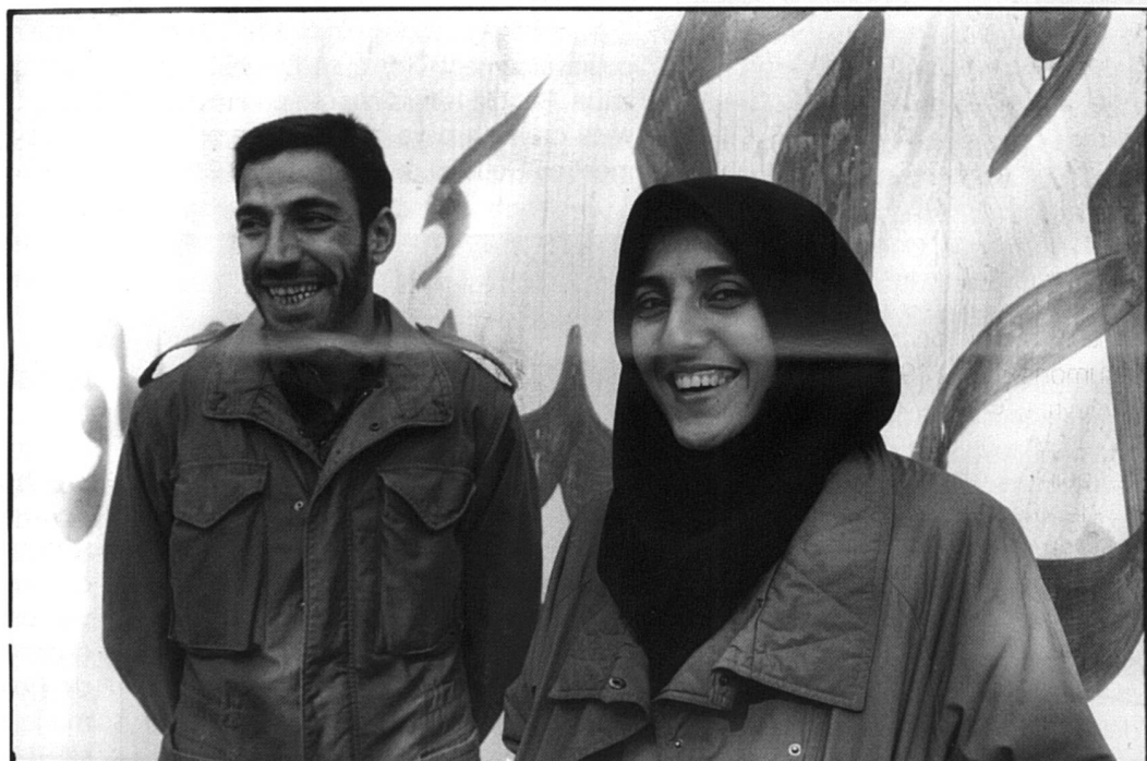
Iran 1985: masculin et féminin, l'uniforme islamique révolutionnaire.