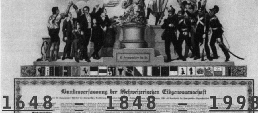
Image tirée de: Erinnerung an den Westfälischen Frieden . Peter F. Kopp, 1998.

«Marabout d'ficelle» poursuit sa série «Idée suisse» avec des portraits de personnages importants durant la période de 1848 à 1914. Du lundi au jeudi à 15h30. Sur RSR, la Première