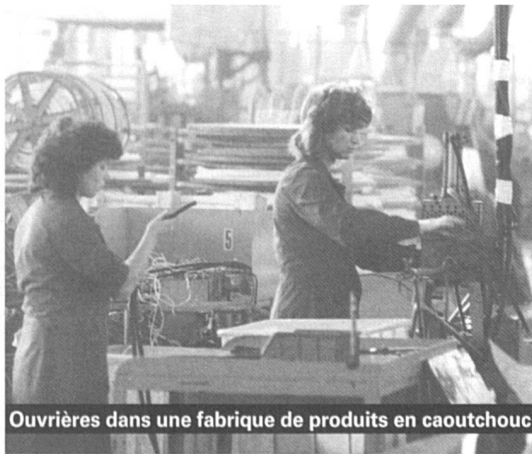
Ouvrières dans une fabrique de produits en caoutchouc