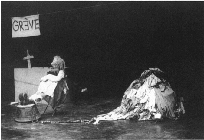
Gardi Hutter.