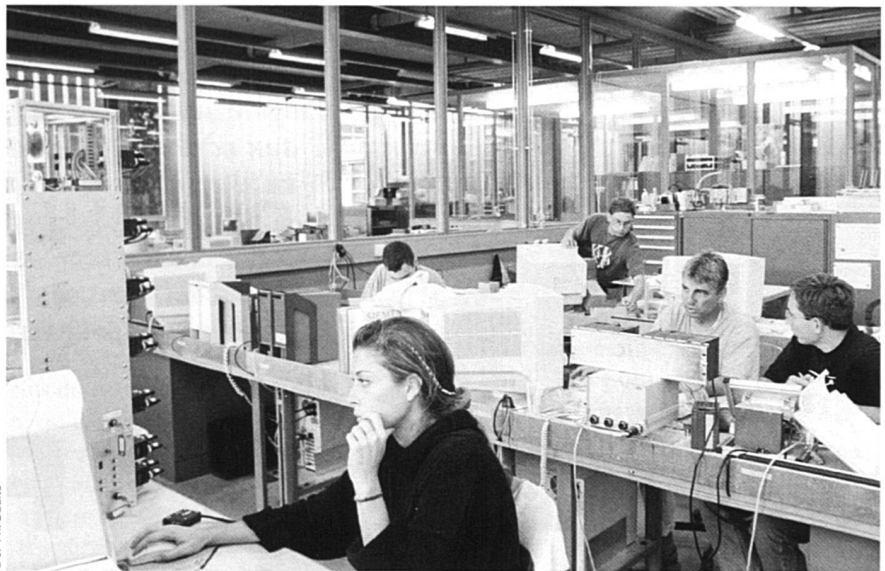
Centre d'enseignement professionnel du Nord vaudois (CEPNV), Yverdon-les-Bains. Élèves de 2 e année en électrotechnique. Une seule femme ?

Dans le cadre du 2 e arrêté fédéral sur les places d'apprentissage (voir encadré), il