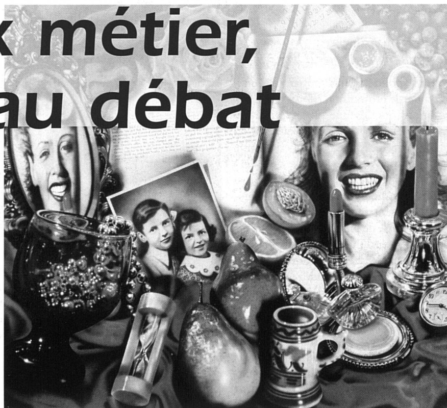
Audrey Flack « Marilyn (Vanitas) », 1977

Ces derniers mois, plusieurs pétitions lancées par des associations abolitionnistes circulaient en Europe pour exiger du Parlement européen des politiques visant à mettre fin à la prostitution. Opposées à la légalisation de la prostitution, les abolitionnistes critiquent les pays européens, tels la Belgique, l'Allemagne et les Pays-Bas, qui suivent une politique de légalisation de la prostitution et du proxénétisme. Les abolitionnistes proposent de suivre le modèle de la Suède, qui a adopté en janvier 1999 une loi luttant contre la prostitution en criminalisant les clients. De leur côté, les associations de défense des droits des prostitué-e-s sont clairement opposées à la perspective abolitionniste et favorables à la légalisation ou à la décriminalisation de la prostitution. En Europe, le débat sur la question est vif et les positions se situent entre la criminalisation accrue, une légalisation impliquant une certaine réglementation par l'État, et la décriminalisation absolue de la prostitution.