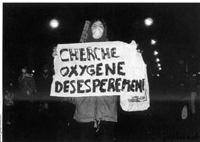
L'effet de serre est un phénomène naturel. Or, l'industrie, l'utilisation des fossiles d'énergie et les transports motorisés modifient l'équilibre naturel de l'atmosphère et augmentent l'effet de serre, entraînant un dangereux réchauffement de la planète. L'Europe est censée diminuer ses émissions toxiques de 10 à 15 % d'ici 2010. Les États-Unis quant à eux, refusent de s'engager dans la même voie. Ils revendiquent même une logique marchande où le « droit de polluer » se négocie en dollars.

propagande, les programmes d'éducation, le changement des lois et la dépendance économique – comme, par exemple, par le piège de la dette. Finalement, cette dévaluation est souvent acceptée et intériorisée par les colonisés comme un état des choses « naturel ». Un des problèmes