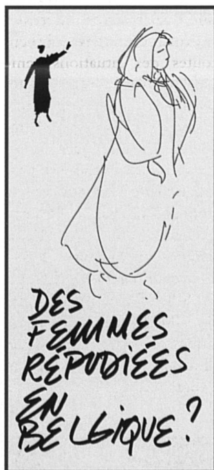
Brochure contre la répudiation publiée par l'organisation Vie féminine

Kensington est un des quartiers les plus pauvres de la ville de Philadelphie, aux