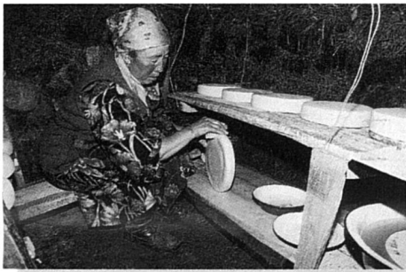
Kysyl Tshydyg