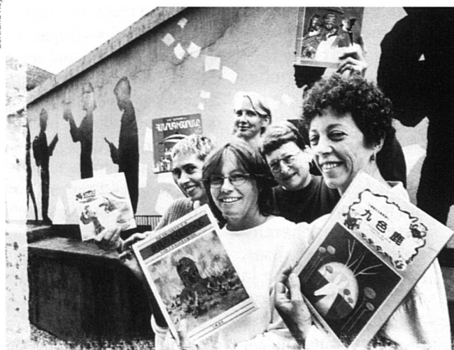
Globlivres met à la disposition de la communauté 15 000 livres représentant plus de 180 langues, tous genres confondus. Après dix ans d'existence, la démarche novatrice de Globlivres reste intacte.