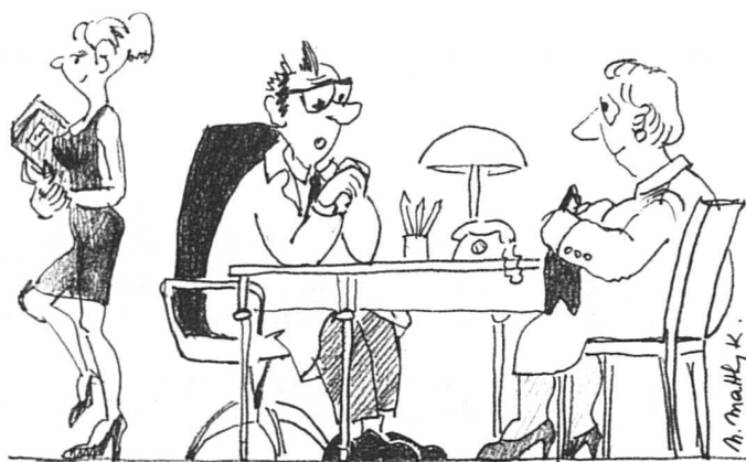
Quelques kilos de trop peuvent rendre les femmes si séduisantes...

Que faut-il en penser? Plusieurs hypothèses se présentent. La doxa féministe nous dicterait évidemment