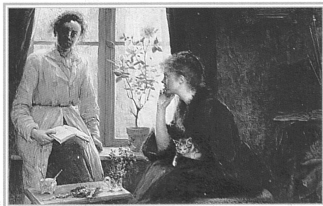
Louise Breslau, Effets de contre-jour, 1888.