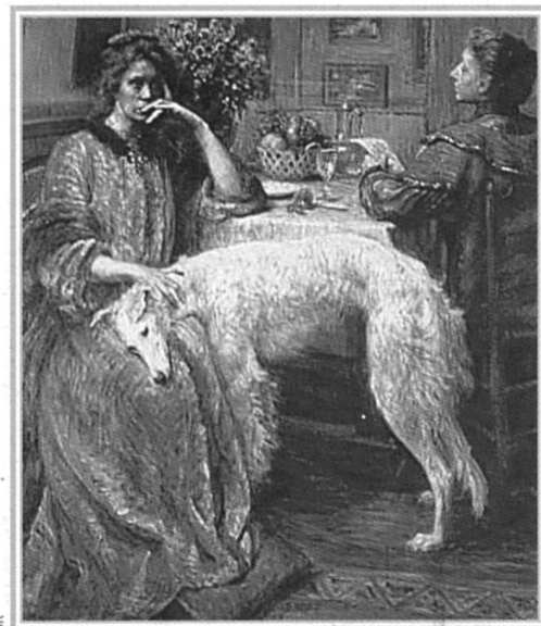
Louise Breslau, La vie pensive, 1908.

FenS: Comment expliquez-vous que ce thème de l'amour lesbien ait été traité si souvent?